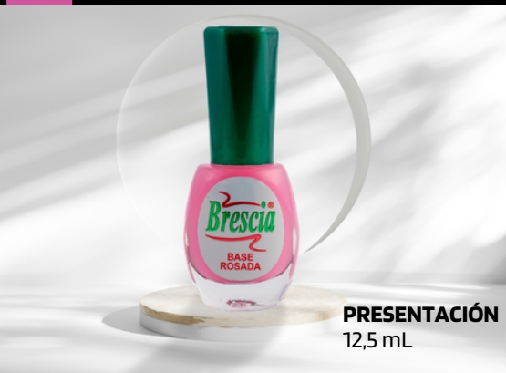
PRESENTACIÓN 12,5 mL