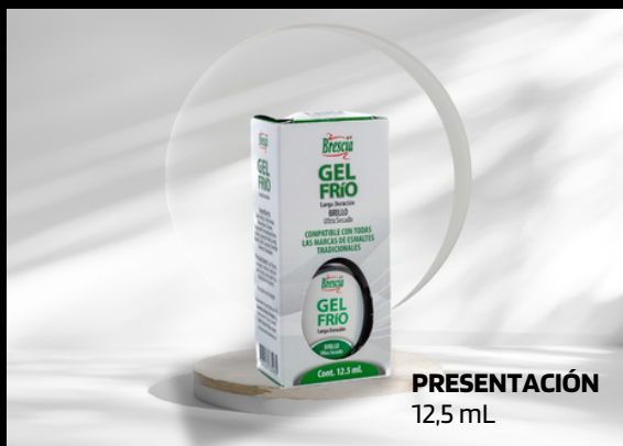
PRESENTACIÓN 12,5 mL

Puede usarse sobre decorados, aplicando una capa más gruesa.