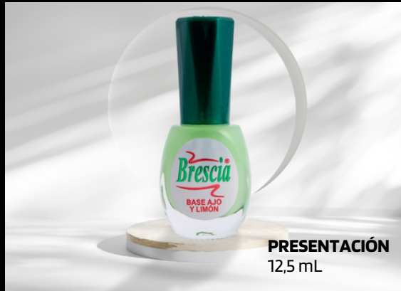
PRESENTACIÓN 12,5 mL

Gracias a las propiedades del ajo y el limón, endurece, protege las uñas de infecciones, hongos y previene el amarillento.