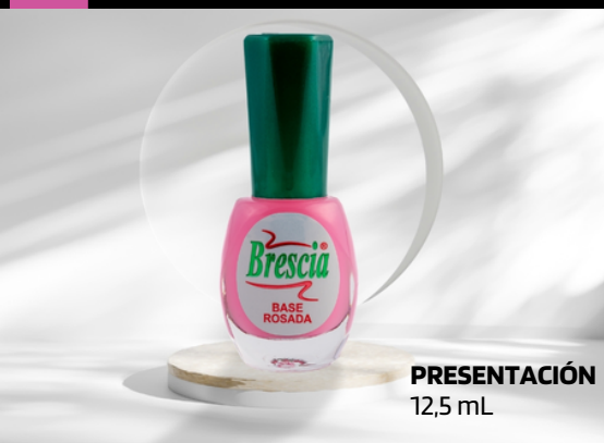
PRESENTACIÓN 12,5 mL