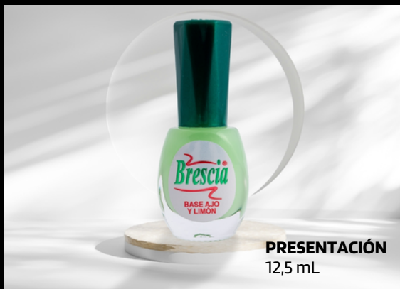
PRESENTACIÓN 12,5 mL

Gracias a las propiedades del ajo y el limón, endurece, protege las uñas de infecciones, hongos y previene el amarillento.