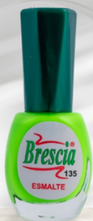
PRESENTACIÓN 12,5 mL