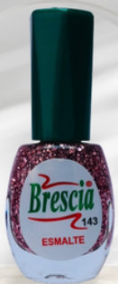
PRESENTACIÓN 12,5 mL