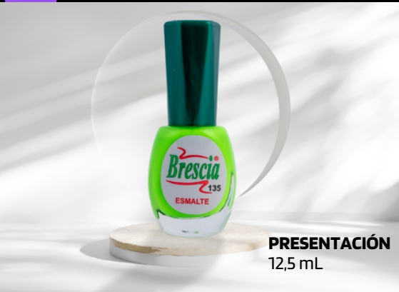
PRESENTACIÓN 12,5 mL