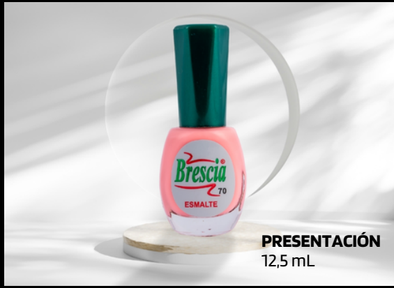
PRESENTACIÓN 12,5 mL