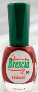
PRESENTACIÓN 12,5 mL