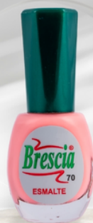
PRESENTACIÓN 12,5 mL